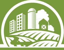
TABLE AGROALIMENTAIRE DE L'OUTAOUAIS