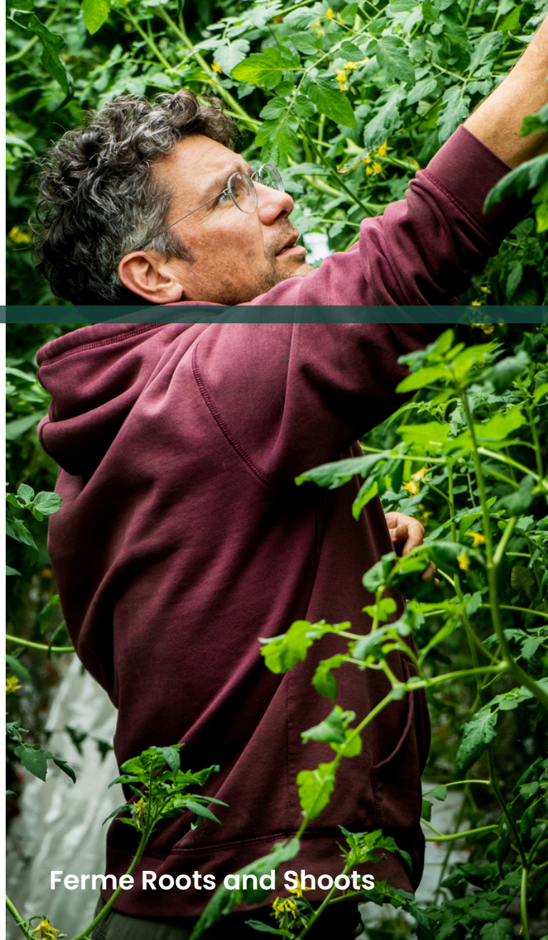
Ferme Roots and Shoots